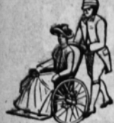
FAUTEUILS ROULANTS pour appartements et jardins.