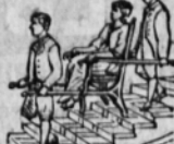
FAUTEUILS-PORTOIRS de tous systèmes.

Sur demande, envoi franco du Catalogue contenant 423 fig.