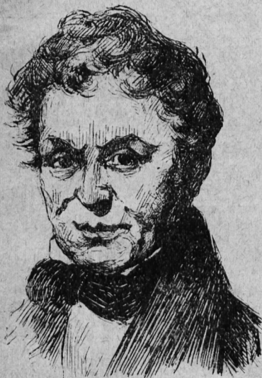
PIERRE-FIDÈLE BRETONNEAU 1774-1863