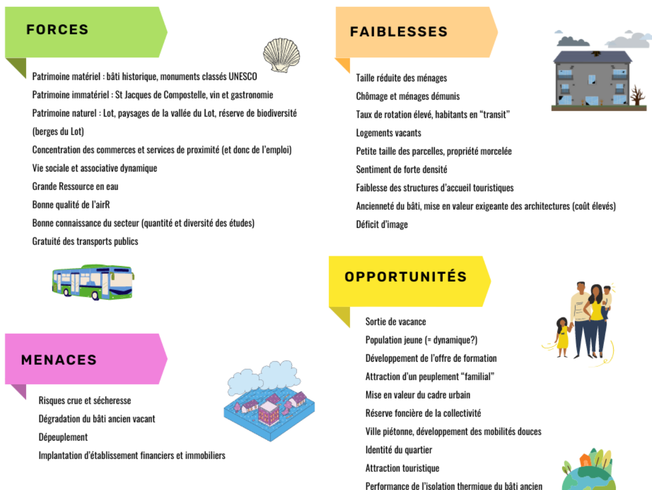
Figure 2: Matrice SWOT de la ville de Cahors, 2023

Nous avons choisi de résumer nos recherches et de les rendre accessibles. Le format de la matrice SWOT nous a semblé adapté pour présenter un diagnostic de l'agglomération où nous avons pu identifier ses enjeux futurs.