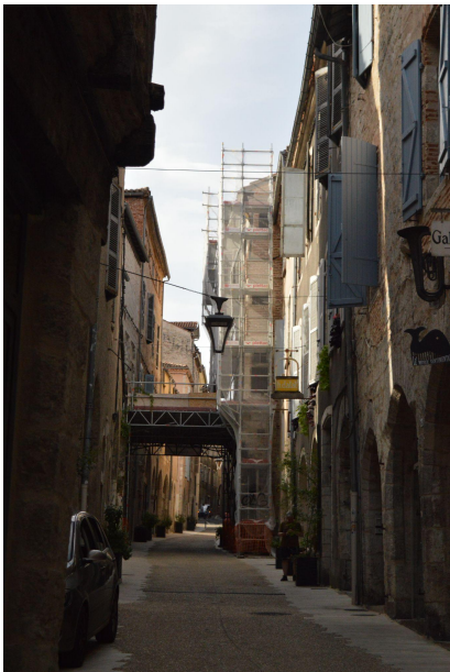
Figure 3: Rue du Château du roi où ont lieu des travaux de réhabilitations du bâti ancien en vue d'en faire des logements adaptés aux familles (Odessa Chorgnon, 2023)

La question a été difficile à aborder puisqu'elle sous entend énormément d'aspects, que ce soit la surface, l'agencement, l'isolation, le placement, ou encore la luminosité du logement. Nous avons cherché dans un premier temps les points négatifs de vivre dans le quartier ancien et avons mis en lumière les problèmes d'isolation évoqués précédemment, la nécessité de réaménager des logements afin d'en agrandir la taille et de les rendre accessibles à des familles et la difficulté de garer une voiture. En ce qui concerne les pollutions, qu'elles soient le bruit, la lumière, chimique ou autres, nous n'en avons pas trouvées. Par rapport au placement, le quartier est au centre de la vie cadurcienne, donc sa localisation est idéale. L'accès à la nature est plutôt direct puisque les berges du Lot sont accessibles directement à pied, et celui à la culture également avec la proximité du musée, du cinéma, mais aussi de la gare, qui permet de rejoindre Toulouse en 1h30. Sachant que des OPAH-RU sont en cours depuis 2020 afin de restaurer ce bâti ancien et de l'adapter pour la vie actuelle, nous avons donc proposé des idées moins imposantes en attendant les travaux ou dans les cas où ceux-ci ne seraient pas possibles. L'une d'entre elles serait la mise en commun d'espaces comme des buanderies afin d'offrir plus de confort aux habitants.