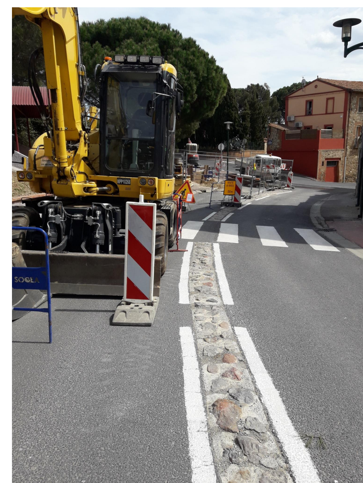
Installation de chantier sur une départementale