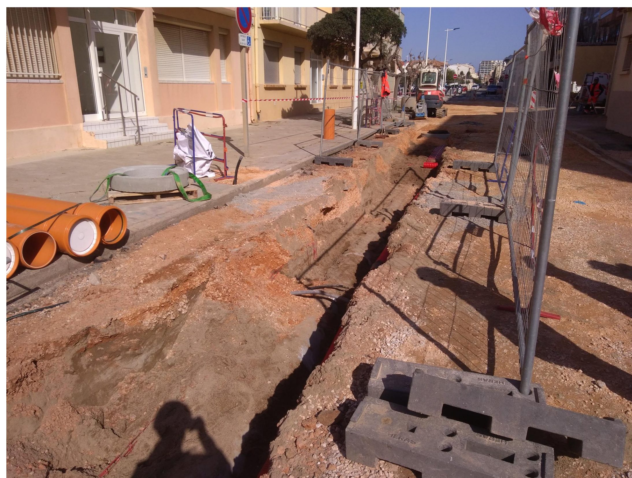
Remblaiement d'une tranchée