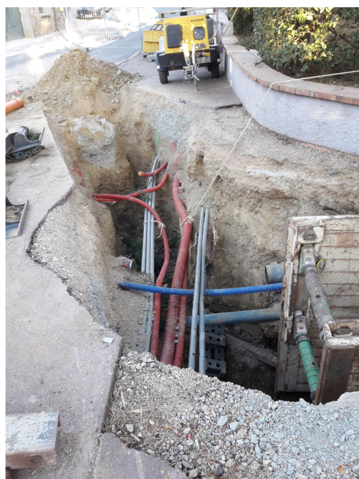
Pose d'une canalisation dans l'encombrement de réseaux

Enfin, le maître d'œuvre assiste le maître d'ouvrage lors de la phase d'Assistance aux Opérations de Réception (AOR), il vérifie que les ouvrages ont été correctement réalisés et ont passés avec succès tous les tests obligatoires.