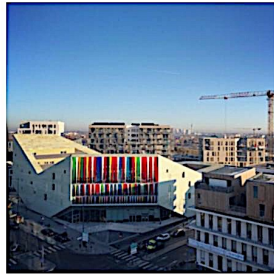
Complexe Stéphane Hessel, Euralille