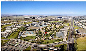
Vue aérienne du projet Ode à la Mer Nature Urbaine