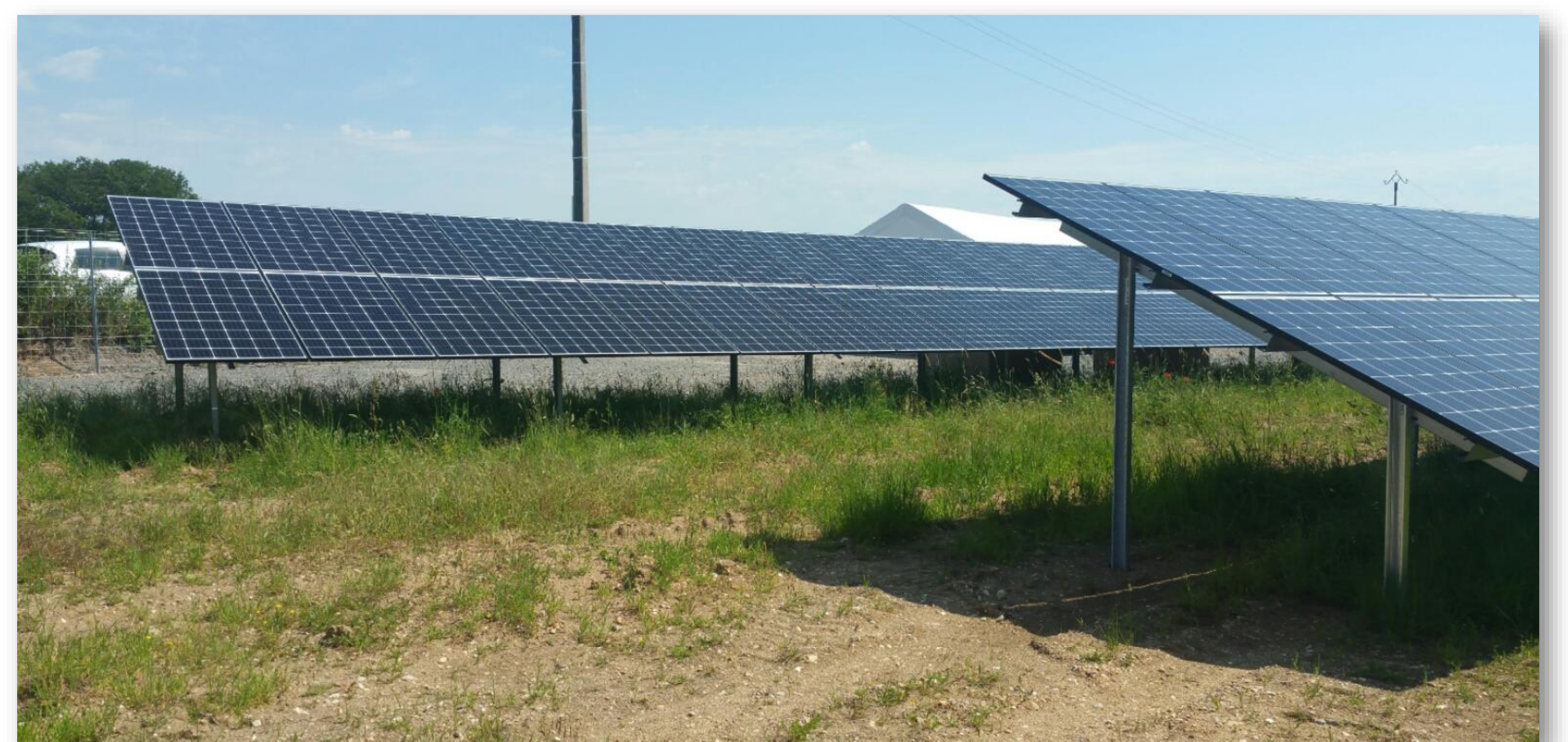
Parc solaire photovoltaïque au sol d'Epineuil-le-Fleuriel (18)