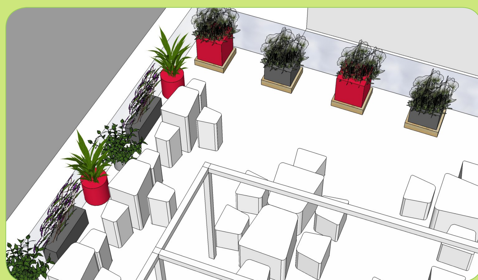
Projet d'aménagement d'une terrasse d'entreprise

Création et entretien de potagers urbains collaboratifs