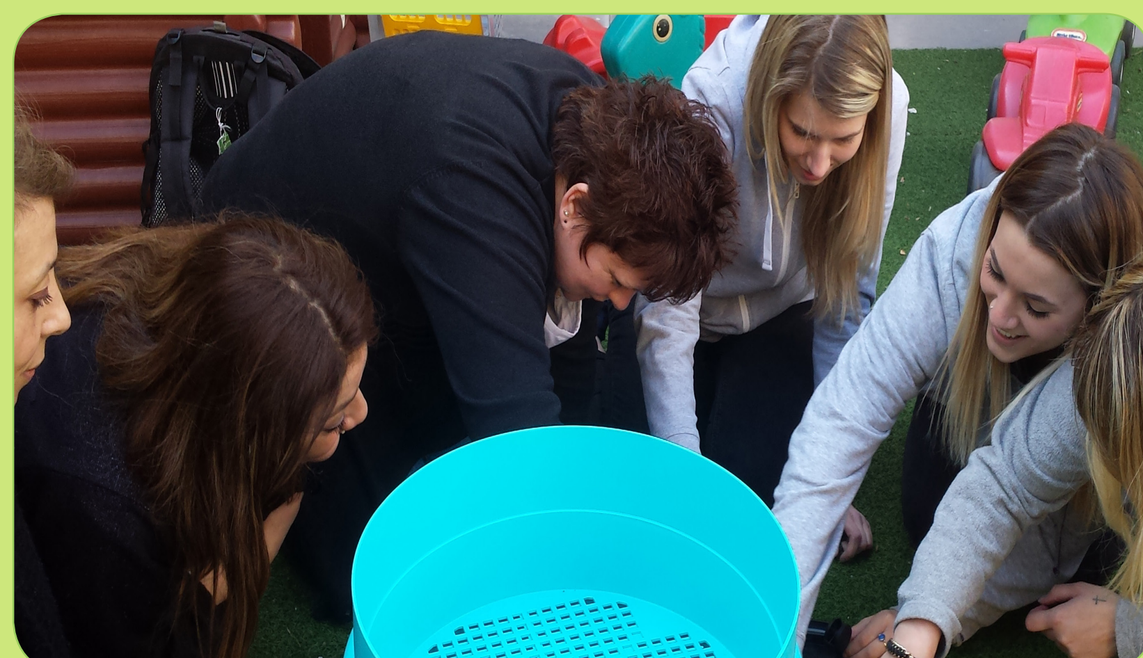
Atelier sur le thème du compostage dans une crèche

Réalisation d'animations en lien avec la transition écologique