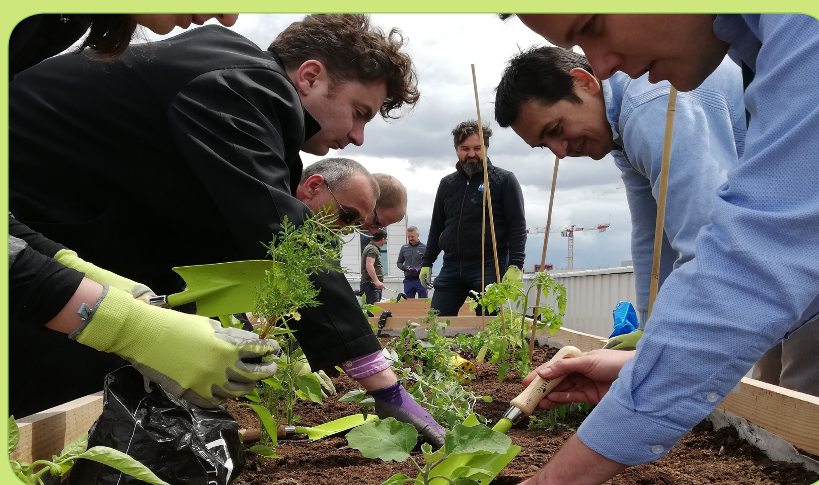
Animation thématique autour du jardinage

Création et entretien de potagers urbains collaboratifs