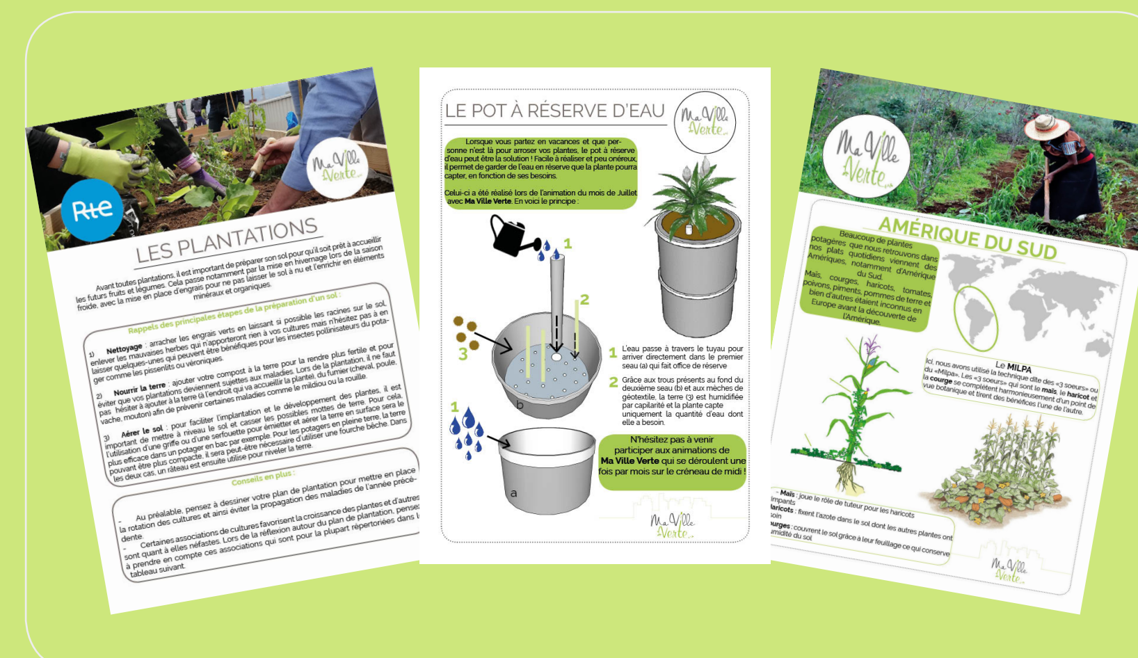
Exemples de différents supports pédagogiques