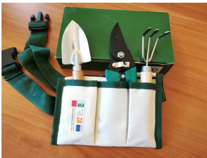
Figure 3: Kit de jardinage offert

Pour chaque projet de végétalisation qui est mis en place, nous offrons à la personne porteuse de projet, un kit de jardinage composé d'un grattoir, d'un sécateur et d'un transplantoir comme le montre la figure 3. Cela permet aux habitants qui ne sont pas spécialement outillés pour le jardinage de pouvoir participer au projet, et peut donc être une motivation supplémentaire pour participer à la végétalisation.