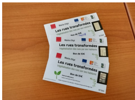
Figure 5: Bon d'achats

Enfin, chaque porteur de projet se voit attribuer 3 bons d'achats d'une valeur de 10 euros chacun utilisable dans 3 pépinières de la ville voir figure 5, pour favoriser le commerce local et le minimum de déplacement. Ces bons ont une durée de validité de 6 mois et permettent d'acheter des plantes, de la terre ou des pots. Les produits phytosanitaires sont absolument exclus du projet, comme cela est inscrit