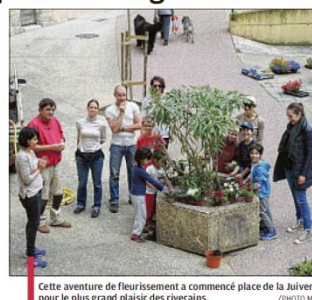
Cette aventure de fleurissement a commencé place de la Juiverie pour le plus grand plaisir des riverains.

Aujourd'hui on transforme les rues Dès aujourd'hui, les habitants peuvent faire la demande d'un permis de végétalisation. Tous ceux qui le désirent : habitants, associations, entreprises ou commerçants, peuvent soumettre un projet d'embellissement de l'espace public à la mairie. Après étude, les services