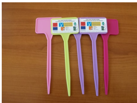
Figure 4: Support étiquette

De plus, chaque demandeur obtient 5 supports étiquette voir figure 4 sur lesquels ils peuvent écrire le nom des plantes qu'ils mettent en place devant, afin que les passants puissent connaître l'espèce. Cette aide rentre dans le cadre de l'objectif de partage et d'échange que le projet souhaite mettre en avant.