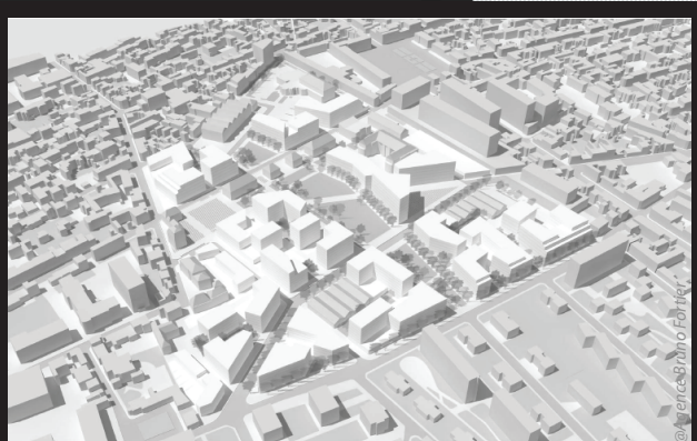
Vue aérienne de l'intégration urbaine du projet

Assistance sur les plans opérationnel, juridique et financier