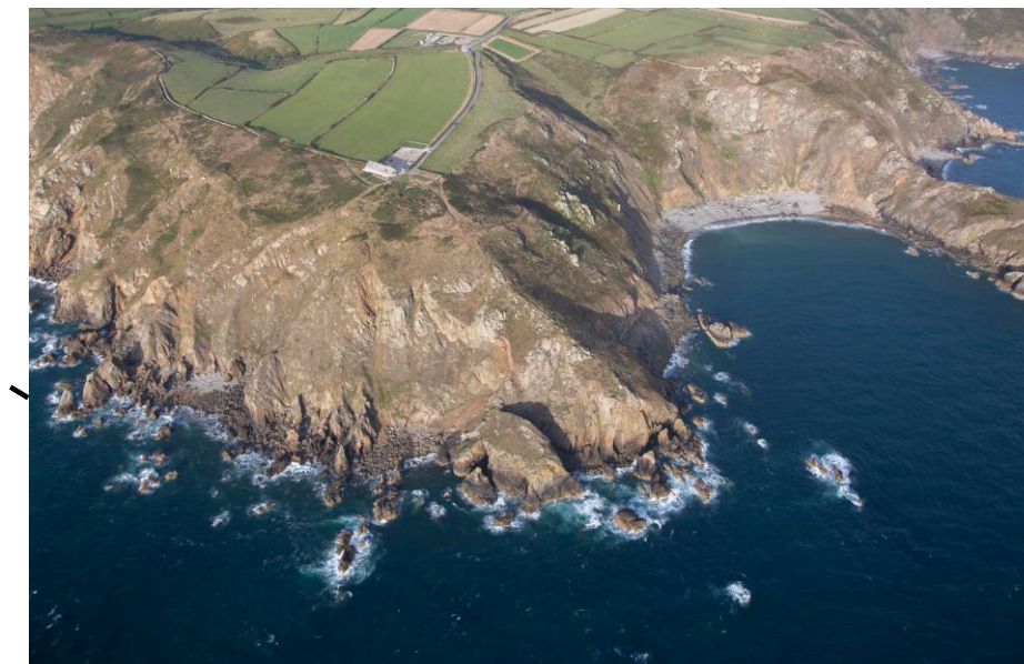
Nez de Jobourg