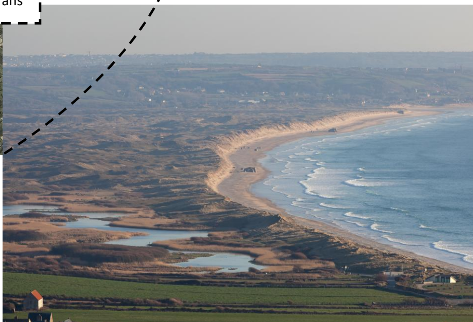
Massif dunaire de Vauville à Héauville