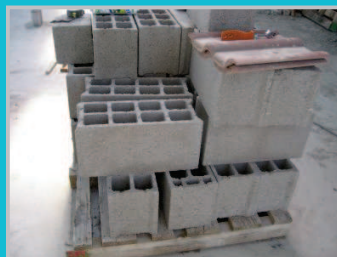
Coût des matériaux