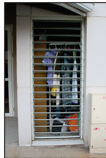
Revêtement et menuiseries extérieures