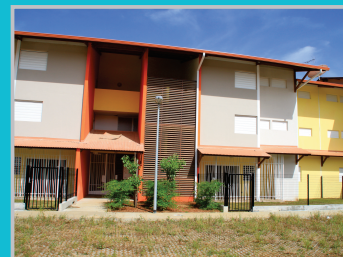
Ouvrage de qualité moyenne

Réceptionner des ouvrages de qualités offrant le meilleur confort aux habitants tout en minimisant le coût d'entretien et de gestion des bâtiments.