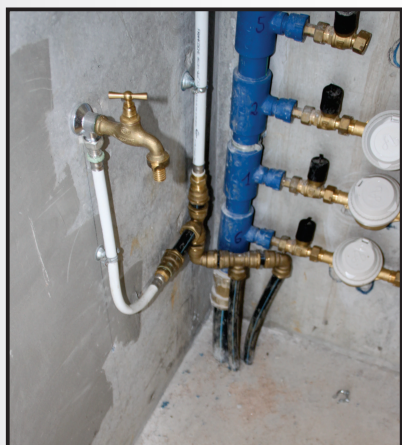
Equipements et gaines techniques