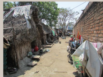
Attur Nagar, Chennai

discontinuités de l'urbain ruptures spatiales