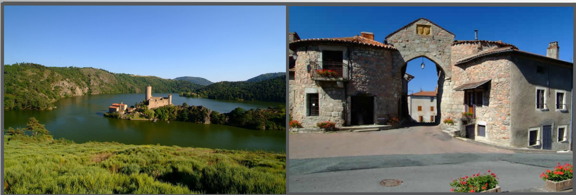
Meilleure valorisation de la Loire et de son potentiel touristique