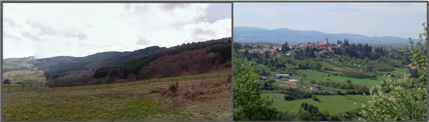
Progression de la forêt Fermeture et banalisation du paysage