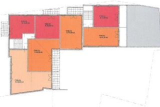
Esquisse d'un projet de 7 logements