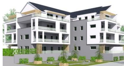
Projet de 20 logements