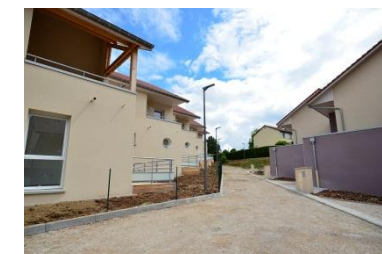
Réception d'une opération de 9 maisons de ville