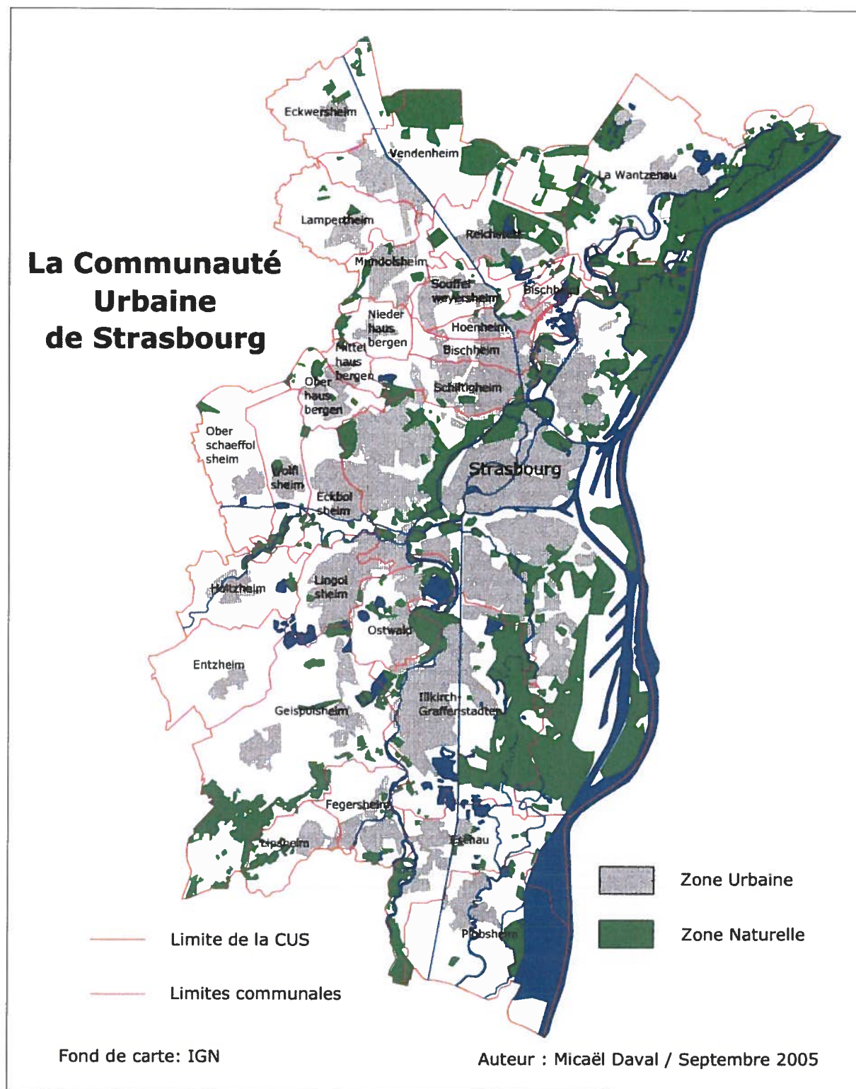
Carte 1: présentation du territoire de la Communauté Urbaine de Strasbourg