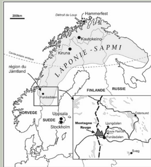
Le territoire traditionnel sami (Truc, 2016)

Alors que la majorité d'entre eux vivent intégrés aux populations nationales, 10 % d'entre eux vivent encore d'un mode de vie traditionnel basé sur l'élevage de rennes.