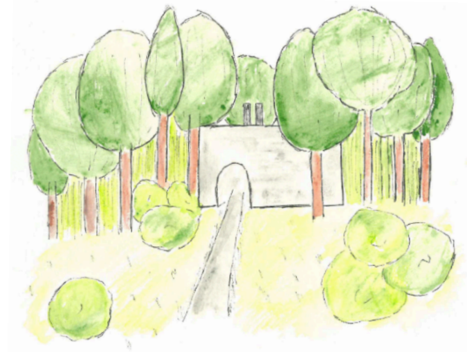
Un patrimoine industriel minier