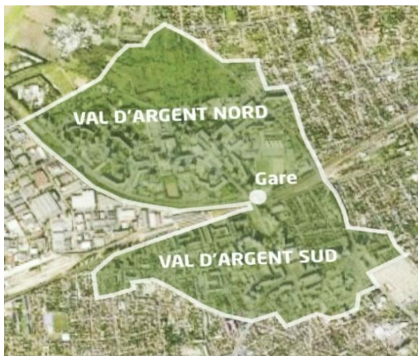
Figure 1: Localisation du quartier du Val d'Argent avec la gare au centre.

Argenteuil est une commune de 104 000 habitants, au nord-ouest de Paris. C'est la commune la plus peuplée du Val-d'Oise et la quatrième ville en population de la région Île-de-France. La ville est divisée en six quartiers 12 dont le Val d'Argent Nord et le Val d'Argent Sud, desservis par la gare du Val d'Argenteuil.