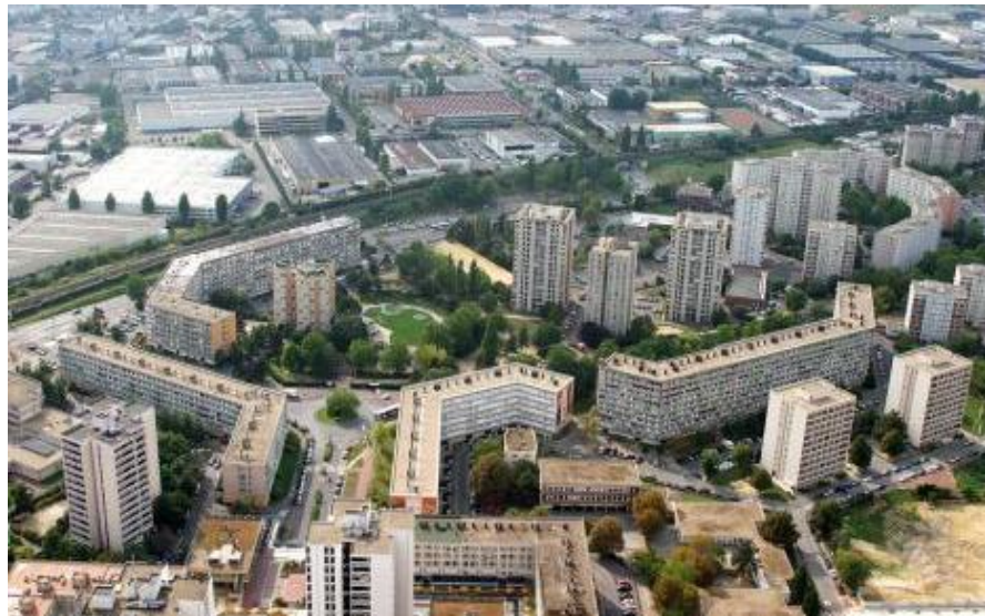
Figure 2: Le quartier du Val d'Argent Nord.

Le quartier bénéficie d'une bonne desserte par les transports en commun, grâce à la proximité de la Gare SNCF du Val d'Argent qui permet de relier le Centre-ville d'Argenteuil en 5 minutes et Paris-St-Lazare en moins de 15 minutes. Le quartier comporte de nombreux équipements : cinq écoles, deux collèges et deux lycées, une antenne de l'IUT de Cergy-Pontoise, un centre de santé municipal, deux salles municipales, une médiathèque etc.