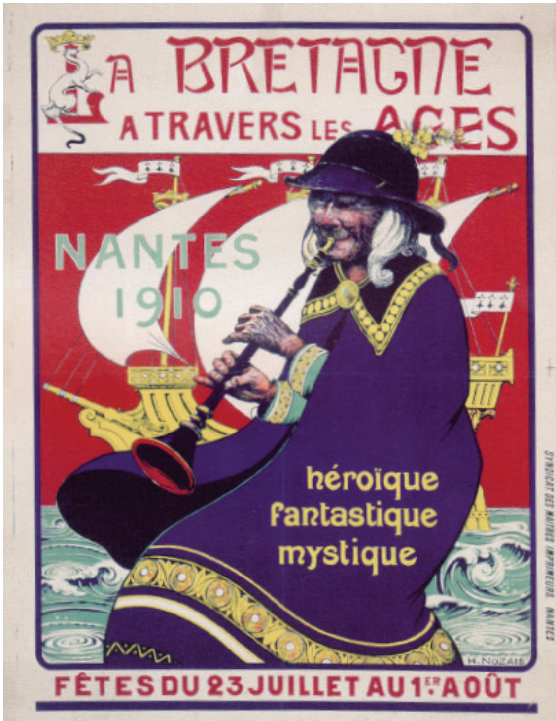
Illustration 2 : Affiche des Fêtes de Bretagne à Nantes en 1910