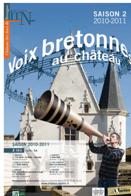
Illustration 7 : Affiche du festival « Voix bretonnes au château »

L'intervention de la ville dans le domaine du patrimoine culturel immatériel peut donc améliorer la visibilité et encourager la