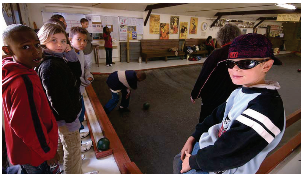
Illustration 6 : Enfants de l'école Diwan participant à une séance d'initiation à la Boule nantaise

La DP Arc aide aussi à la mise en relation entre les acteurs culturels locaux. Elle a mis en relation la F.A.B.N. et l'école bilingue 1 Diwan. Une classe de CM1/CM2 participe à sept ou huit séances d'initiation dans l'année.