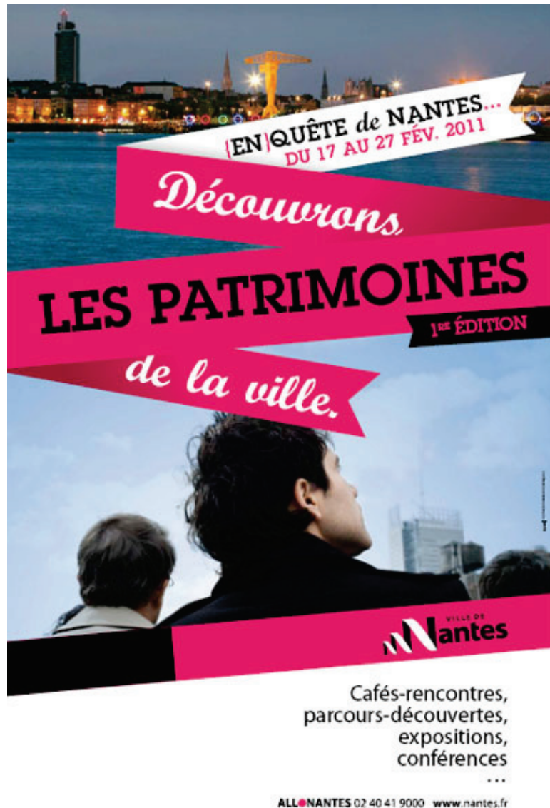
Illustration 5 : Affiche de la manifestation {En} quête de Nantes