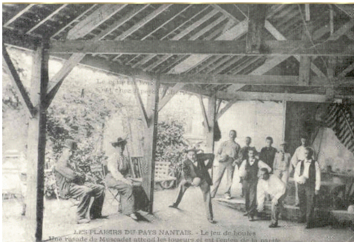
Illustration 4 : « Les plaisirs du pays nantais », photographie d'archives.

Ces trois initiatives nous montrent la volonté qu'il y a à Nantes de préserver les expressions et pratiques culturelles traditionnelles bretonnes dans le paysage culturel de la ville.