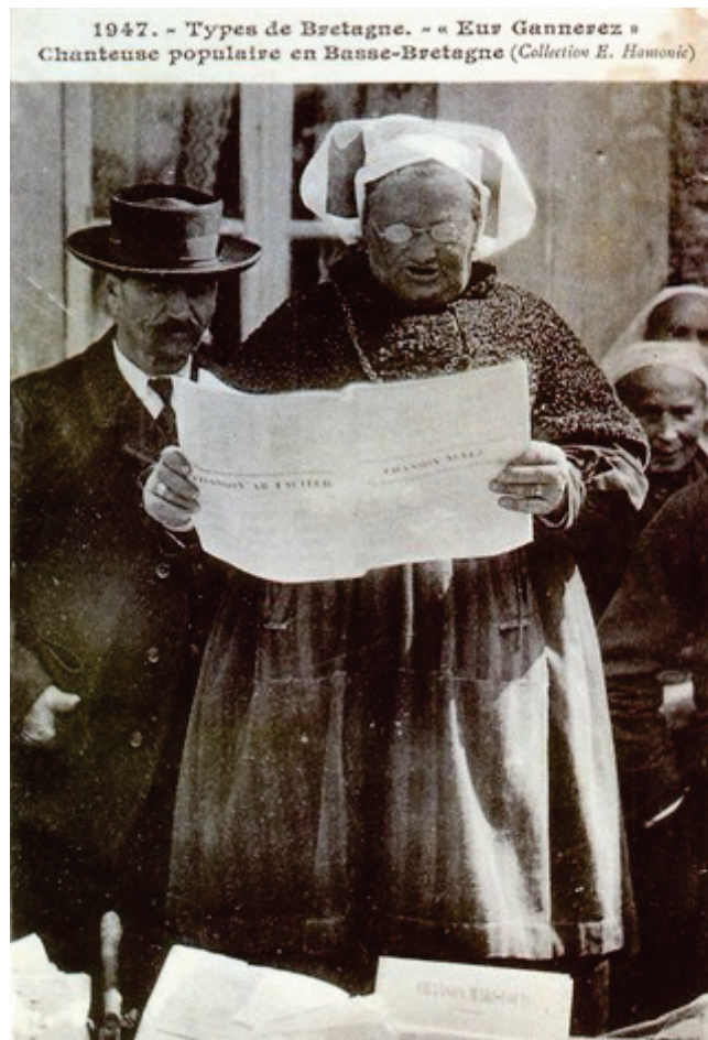
Illustration 3 : Photographie d'une chanteuse populaire prise en 1947 dans la région nantaise

codifiée par écrit (la danse par exemple). » 1 Son action concerne tout le département de Loire-Atlantique mais l'association détient ses bureaux et archives à Nantes.